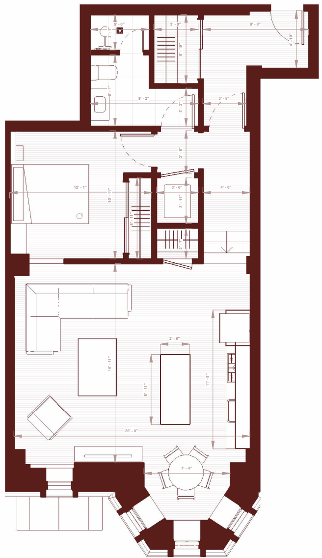
PLAN DE LOCATION